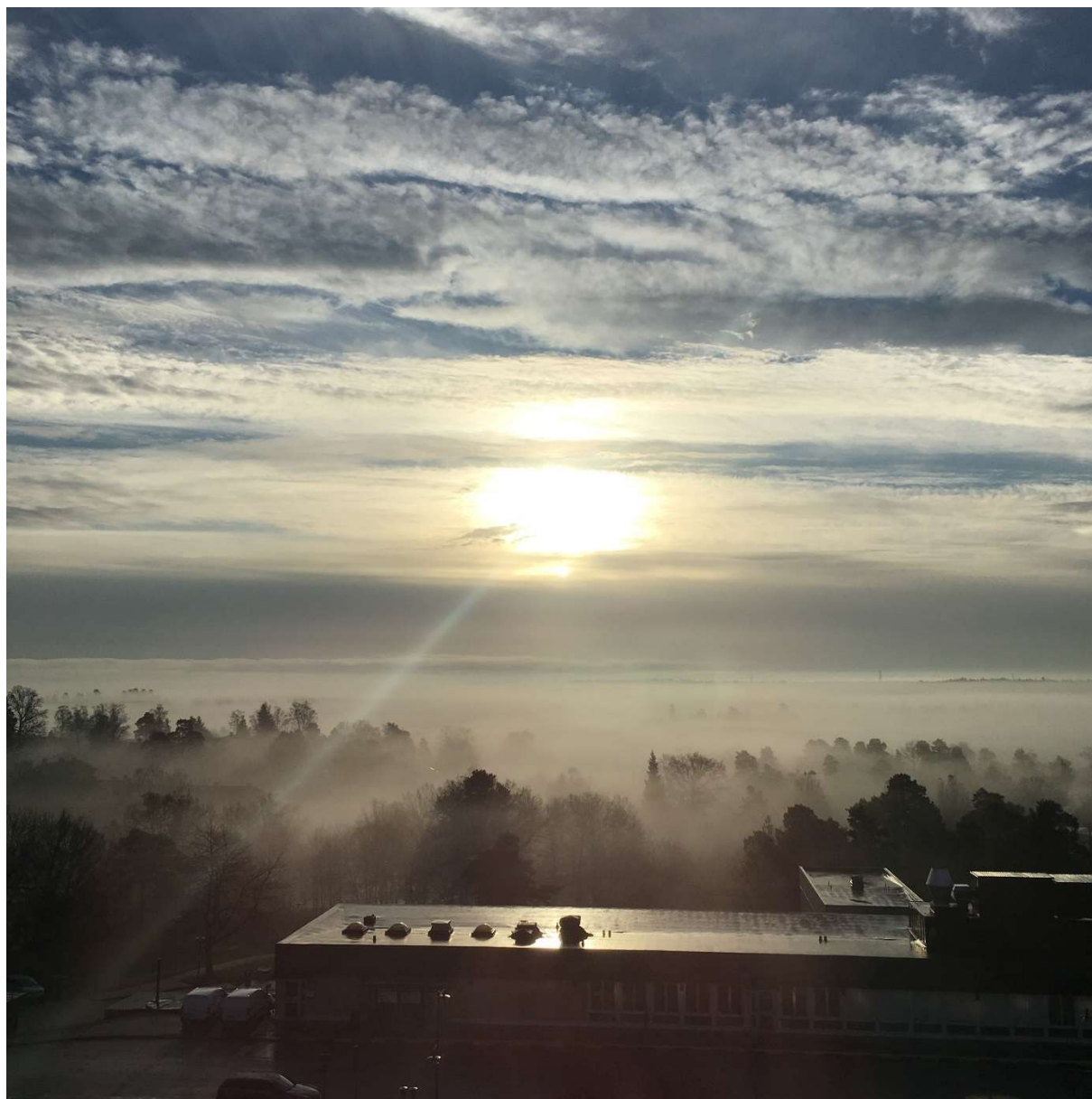
Oktobervy – Nacka sjukhus